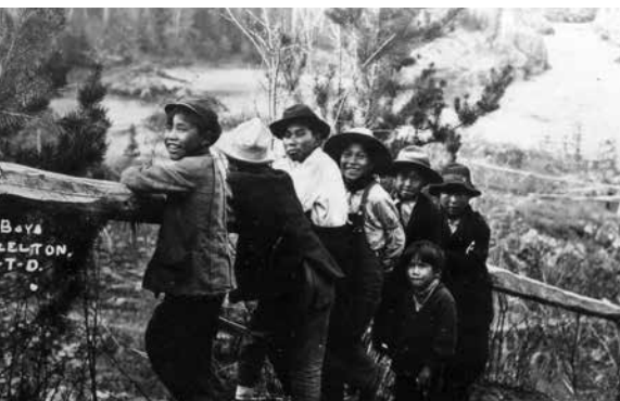
v. 1914 : Village de Hazelton (C.-B.), où se trouve un poste de traite – en 1977, la Banque Royale déménage cette succursale dans le village autochtone de Hagwilget.