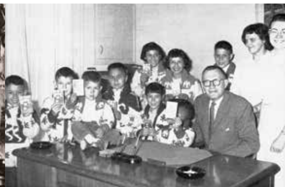
1961 : Neuf nouveaux clients ouvrent un compte de la Banque Royale à Terrace (C.-B.).