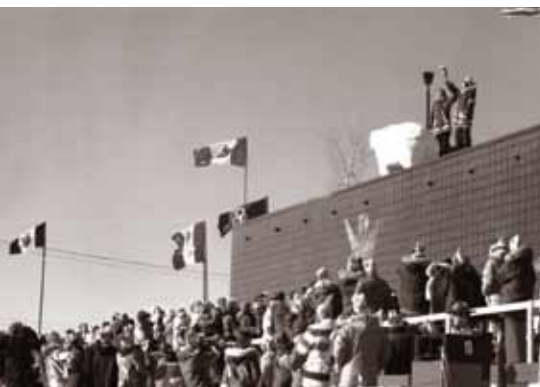
1978 : Jeux d'hiver de l'Arctique, Hay River (T. N.-O.) – soutenus par RBC depuis 1977.