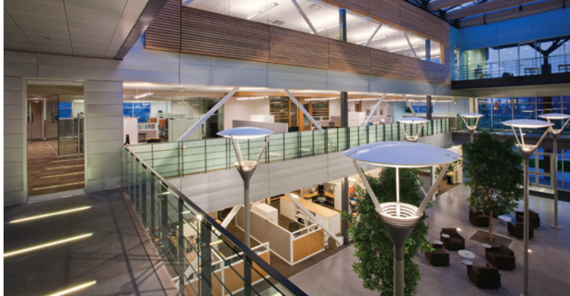
Ritchie Brothers Auction, Vancouver (Colombie-Britannique)

Selon l'EPA aux États-Unis, l'air à l'intérieur peut être plus pollué que l'air à l'extérieur, et ce, même dans les plus grandes villes industrialisées. Comme les gens passent environ 90 % de leur temps à l'intérieur, l'EPA estime que la pollution de l'air intérieur coûte chaque année jusqu'à concurrence de 60 milliards de dollars aux entreprises américaines en pertes de productivité.