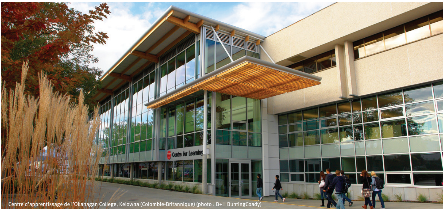
Centre d'apprentissage de l'Okanagan College, Kelowna (Colombie-Britannique)