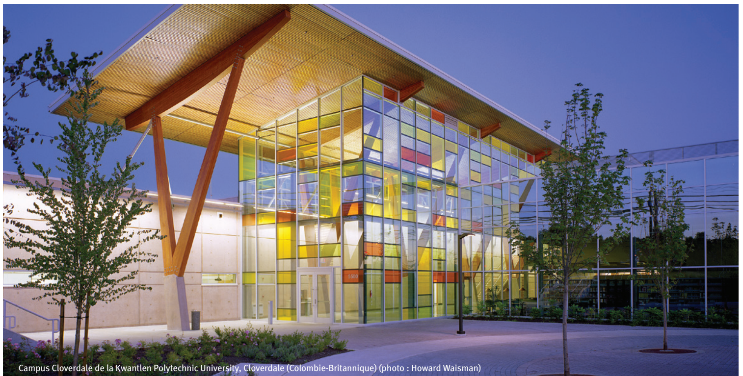
Campus Cloverdale de la Kwantlen Polytechnic University, Cloverdale (Colombie-Britannique)