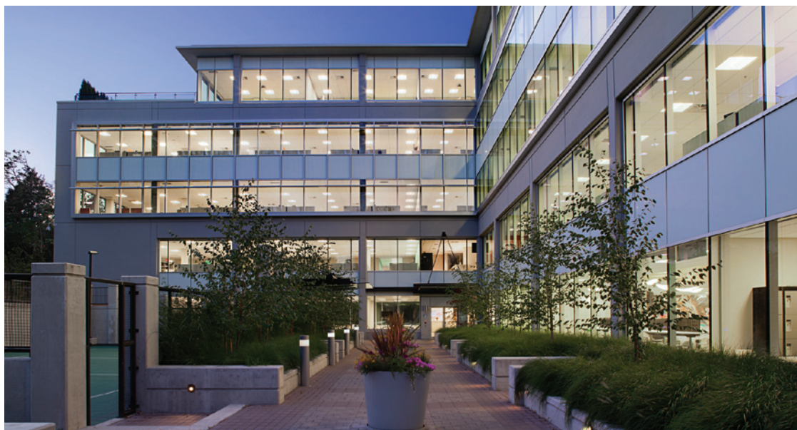
Discovery Place, Vancouver (Colombie-Britannique)

La norme LEED devient rapidement la norme prédominante en matière de bâtiments écologiques. Dans le cadre d'un sondage auprès des dirigeants de sociétés immobilières, 83 % des répondants ont indiqué qu'ils tenteront « très probablement » ou « probablement » d'obtenir la certification LEED s'ils construisent un bâtiment écologique au cours des trois prochaines années 21 .