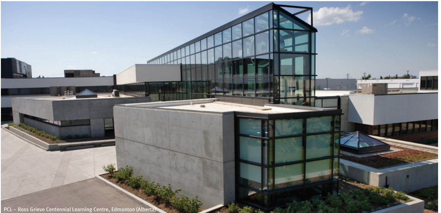
PCL – Ross Grieve Centennial Learning Centre, Edmonton (Alberta)